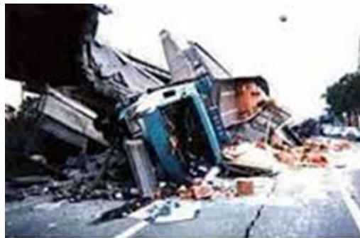
瓦礫・廃棄物発生