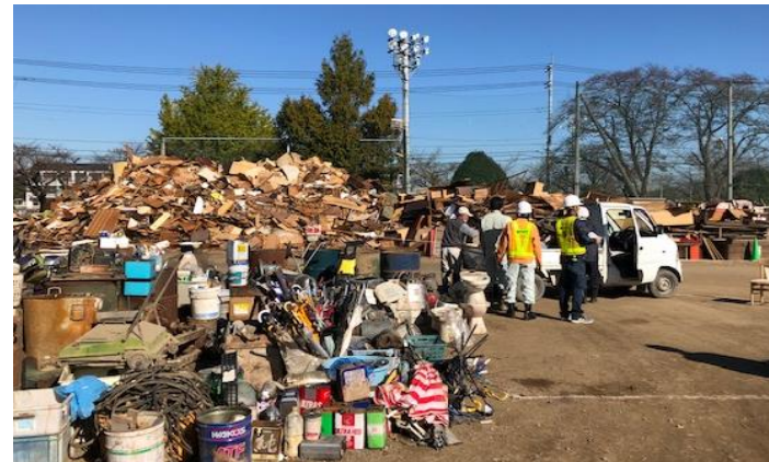
回収・分別・廃棄